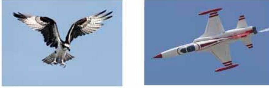
Resim 7.1. Düzanlam ve Yananlam Örneği [12]

nitelendirmektedir. Düz anlama ideolojik bir gösterilenle ilişkilendirilmek suretiyle yan anlamın yoksullaştırıldığını savunur [5]. Bu nedenle yan anlam göstergesi kullanan tüm kültürel unsurlar aracılığıyla, değerlerin temsil düzeyinde düz anlamın yeniden biçimlendirilmesidir. Günümüzde kitle iletişim araçlarının ideolojik içerikleri bu şekilde üretmektedir. İnal'a göre Barthes bu durumu yan anlamın düz anlama yaslanması olarak ifade eder. Bunun sonucu olarak düz anlam ve yan anlam bir bütünlük içinde karşımıza çıkar ve ideolojik olanı gözden siler. İşaret gerçekliğini kurar ve okuyucuya dayatır [11]. Düz anlam ve yan anlam konusu ile ilgili örnek Resim 7.1'de gösterilmiştir.